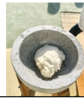
ふんわりもちもち おもちが完成