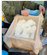
水に浸したお米を